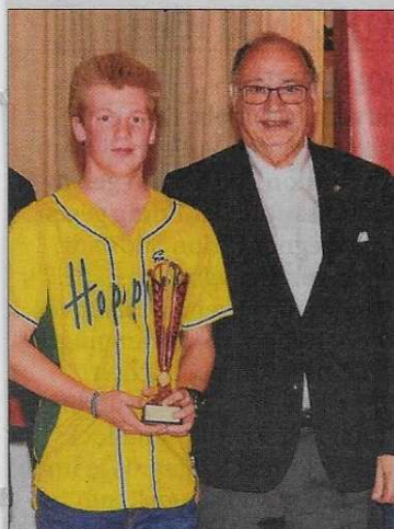
Die U16 Mannschaft der Hoppers holte den dritten Platz bei den österreichischen Meisterschaften.