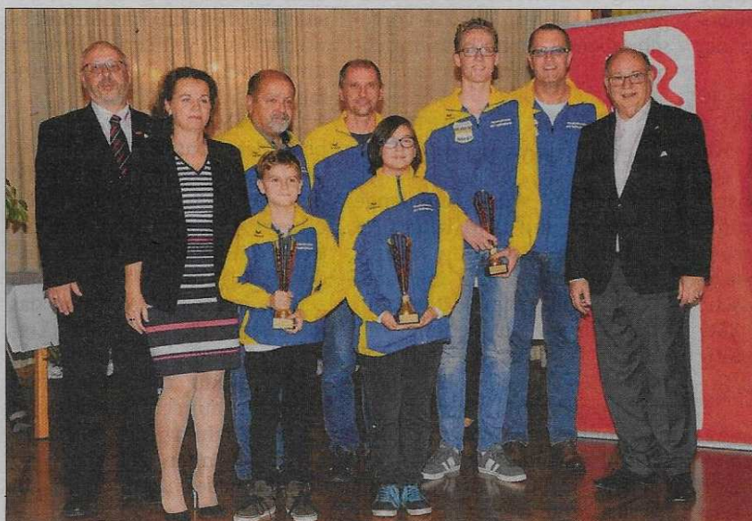
Die Faustballer des ATV Kottlingbrunn durften für die Mannschaft U10 (1. Platz Hallensaison 2015/2016), das Team U12 (1. Platz Feldsaison 2015/2016) und die Mannschaft U18 (1. Platz Hallensaison 2015/2016, 1. Platz in der 2. Landesliga, 1. Platz Feldsaison 2015/2016) Auszeichnungen entgegennehmen.